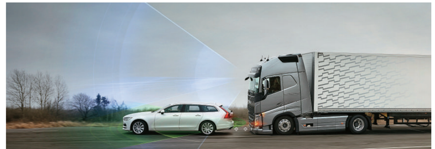
右頁 圖 / AEBS會自行偵測與前方車距，若發現有碰撞危險就會分階段性警示甚至介入煞車，避免碰撞危險。

這是交通部自去年1月強制大型車輛裝設行車視野輔助系統及轉彎、倒車警報裝置後，下一步針對大客車、大貨車及曳引車所進行的全新安全檢測基準；在更符合科技潮流的規定下，未來駕駛者將能夠在各項技術輔助下，將行車安全大幅提升，而其他用路人也會同時在人車安全上獲得更完善的防護。