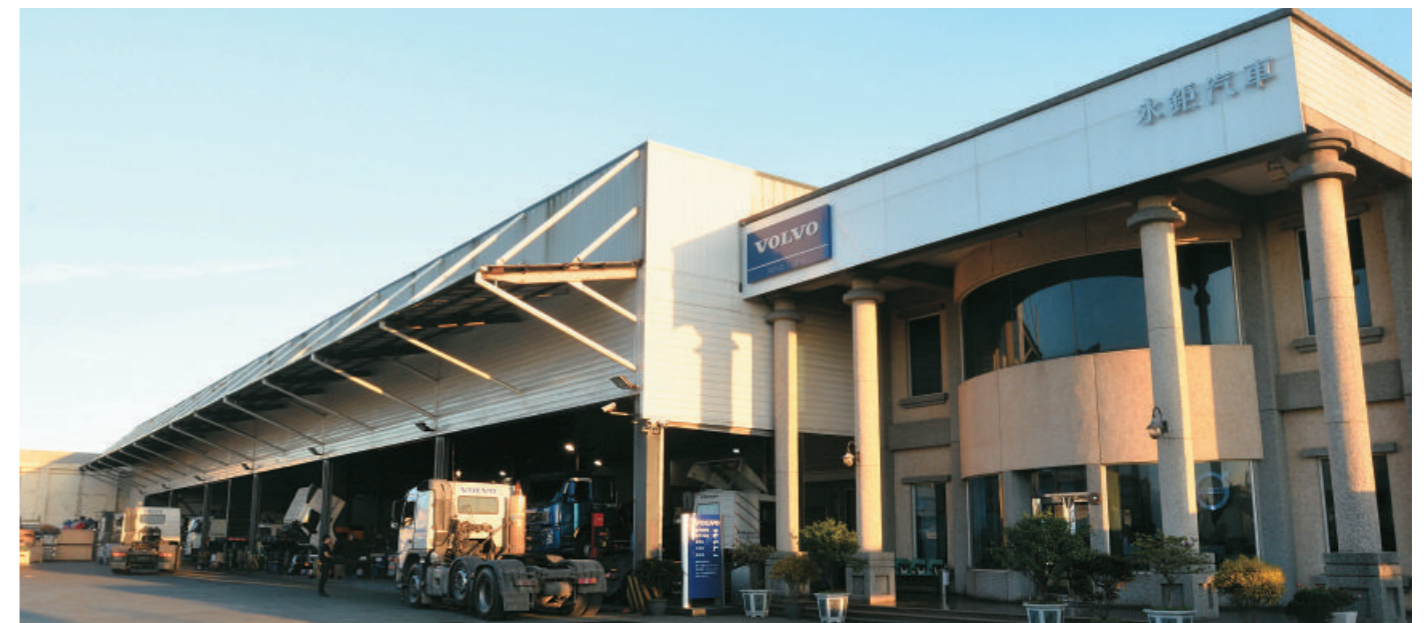
目前服務中心有 10 個車位，完善的零件管理讓車主前來保修時能一次解決所有問題，便利和高妥善率讓客戶相當放心。

至於未來的規劃，他表示目前宜蘭服務中心的產能已經達到飽和，有準備好服務二廠擴建的計畫，從客戶的反應中讓他理解到售後服務對市場銷售的重要，加上 Volvo 商用車的零件可靠度已經建立起口碑，客戶對品牌意見快速反應上也得到很好的成效，作為一個投資者，更加放心與原廠的合作；而作為一個經營者，讓員工能在這樣原廠規範的優質環境裡發揮所長，也讓他對服務的品質深具信心。