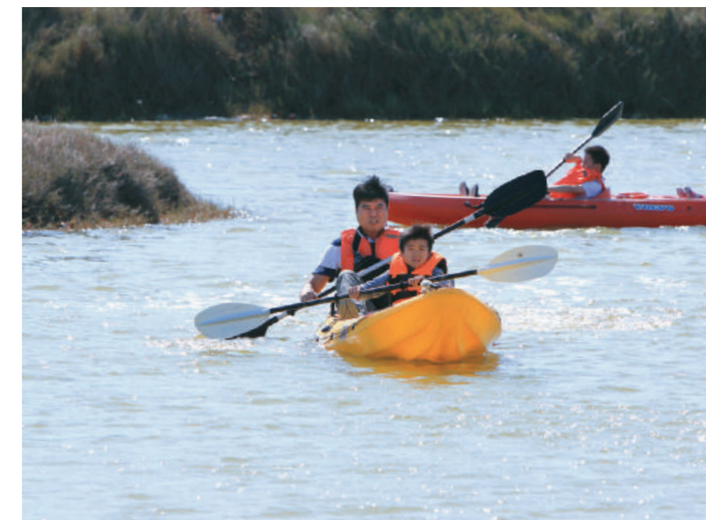
右頁 右下圖／現場的另一側，透過「嘉義縣體育會獨木舟暨輕艇委員會」的專業指導，大人和小孩們也踴躍排隊進行獨木舟體驗。