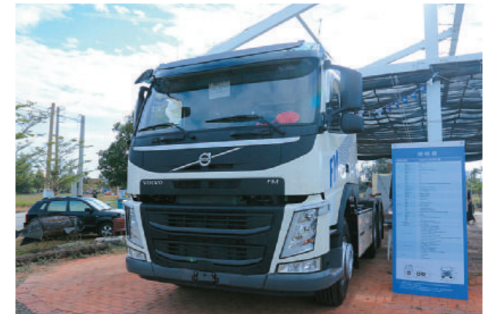
右頁 圖 / 此次在園區入口處體現品牌精神的FM62T 500，自然是許多車主們入鏡和爭相觀摩的當日焦點之一。

不僅慰藉了每位 Volvo 商用車車主的辛勞，也讓他們終年奔波勞動的汗水，與洲南那風吹日曬的鹽田記憶相互輝映，展現出為家庭、為所愛的人認真打拼的堅毅精神。