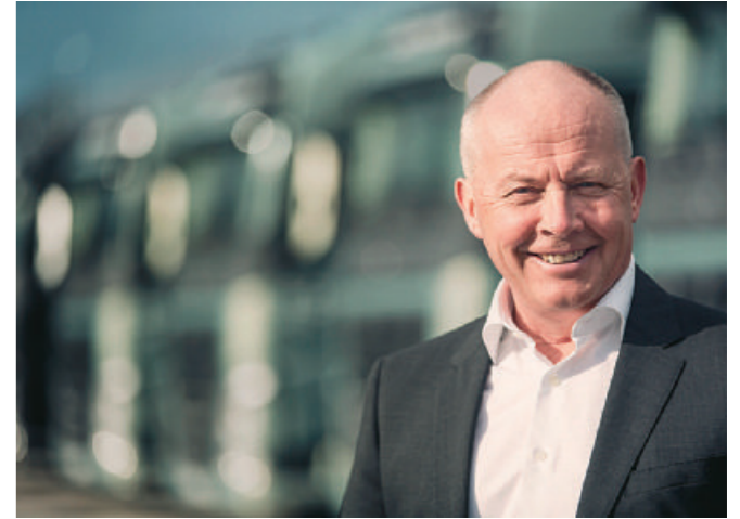
Volvo Trucks集團總裁Claes Nilsson認為，FH的出現對90年代市場經濟與運輸業之復甦，貢獻了極大的推力。

許多駕駛者都受惠於I-Shift 雙離合器變速箱的便捷，讓重型卡車的性能與生產力標準提升到全新的境界。這項配