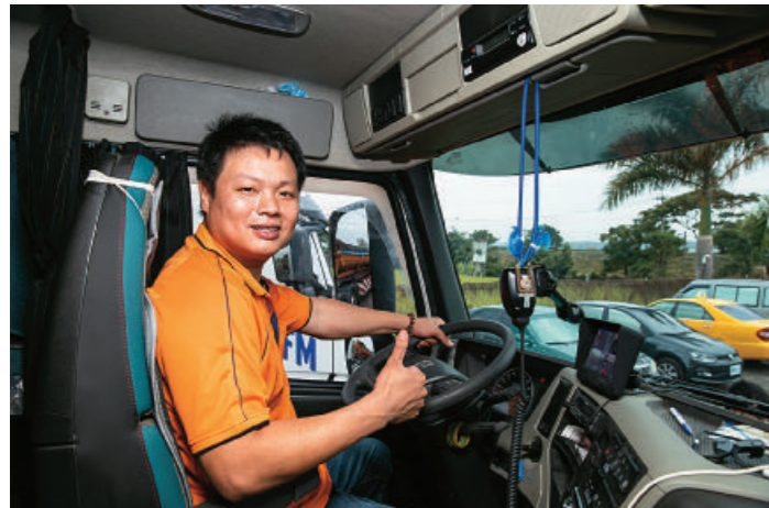
右頁 圖／全公司共有10幾位司機，他常要求員工時時留意品質管理，因此車輛總是呈現相當乾淨的外觀。