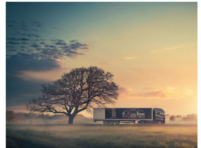
2013年便開始實施的歐盟六期標準，在2019年於台灣正式上路後，將針對柴油車和輕柴油的懸浮粒子等進行更嚴格的把關。

台灣方面，行政院環保署早於2016年就已先行研擬，將以歐盟六旗標準法規參考，針對交通工具空氣汙染物排放標準第五條修正重點增列「108年9月1日施行之柴油及替代清潔燃料引擎汽車排氣管排放空氣汙染物標準」（簡稱第六期排放標準）。加嚴之第六期排放標準，其主要差異為測試方法比照歐盟六期將從ESC & ELR測試型